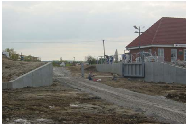
Fluttur über BHW in Hochwasserschutzlinie