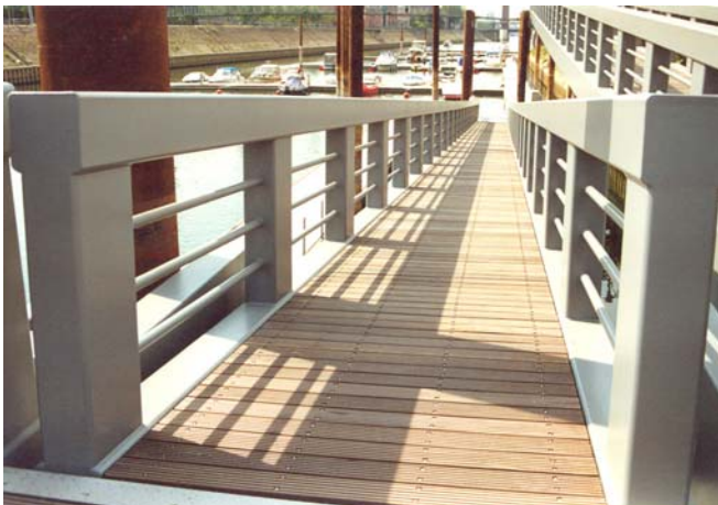
Rampe 2 x 45 m auf schwimmenden Ponton gegründet