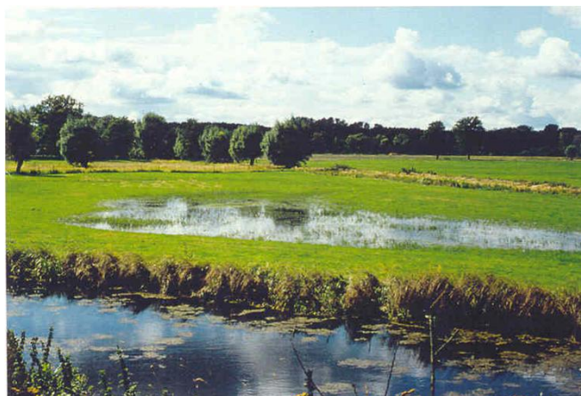
Streetzer Mühlenbach 2 Jahre nach der Renaturierung